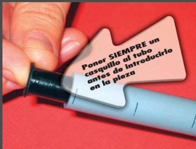
2. Introducir el casquillo