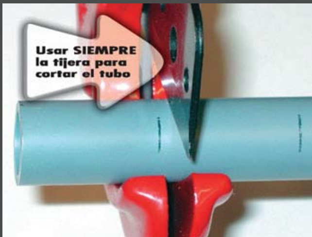
1. Cortar el tubo